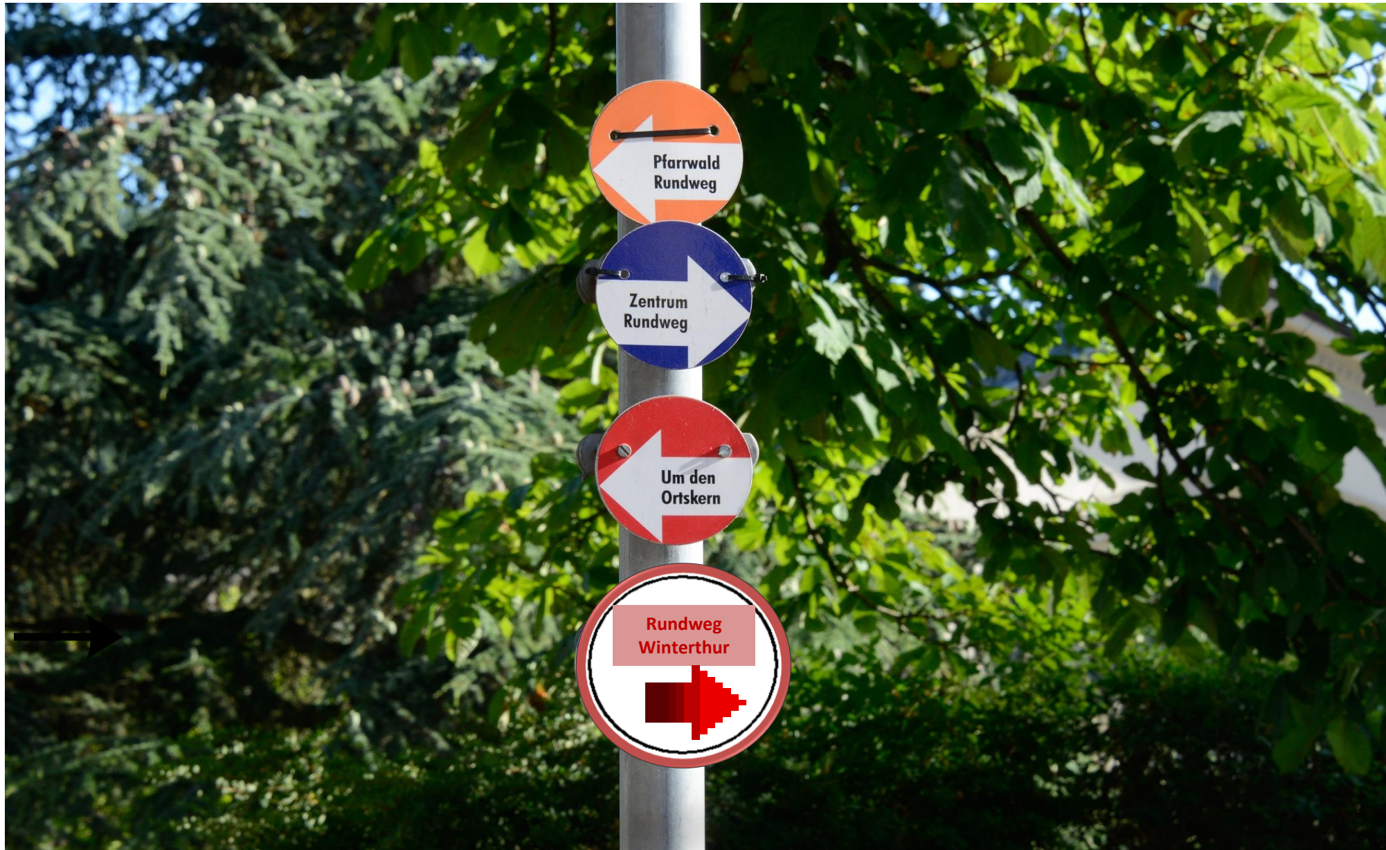
Pfarrei St. Ulrich, Winterthur-Rosenberg